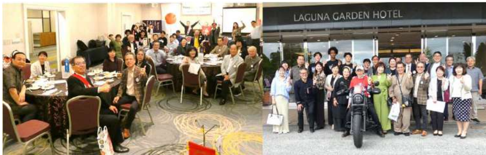
第2688回の例会を終えて(^^)