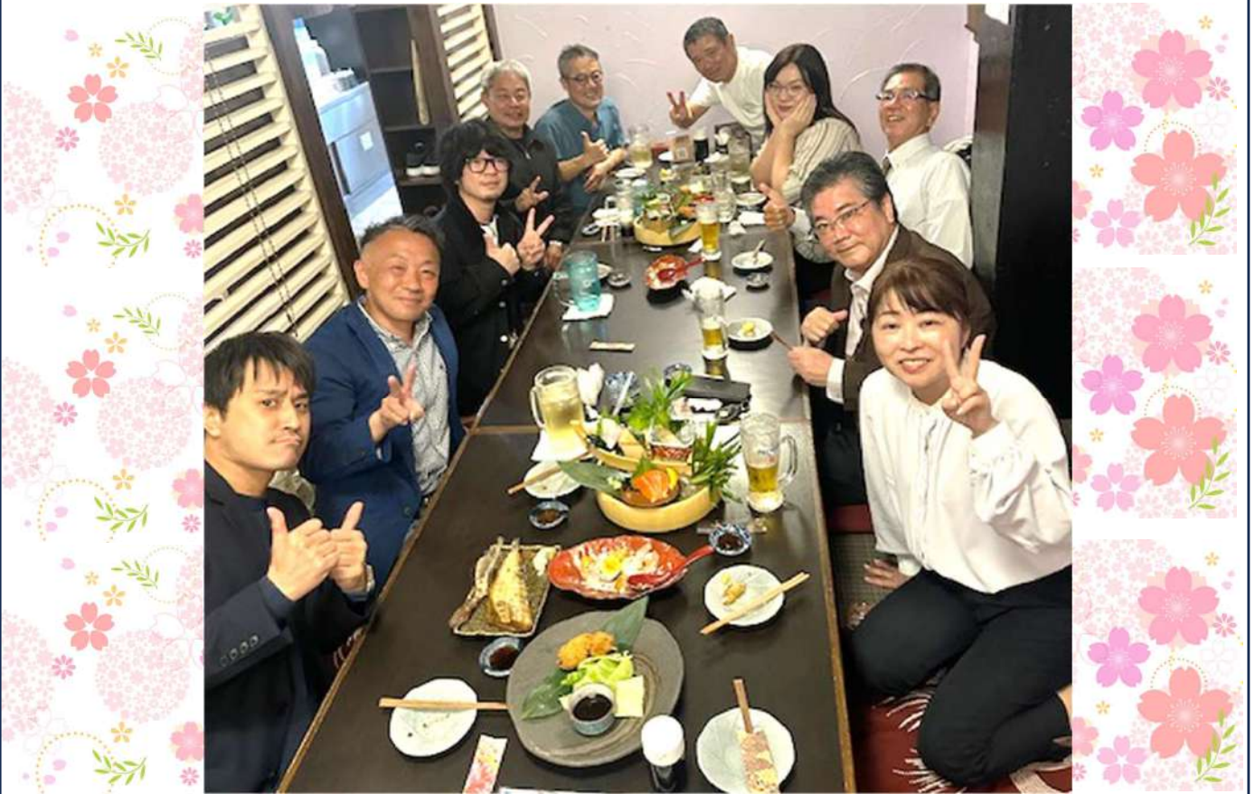
会員からの情報（新聞記事）