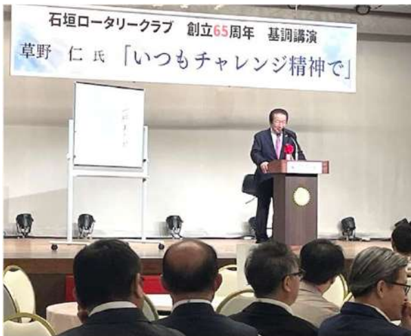
基調講演 草野仁氏「いつもチャレンジ精神で」