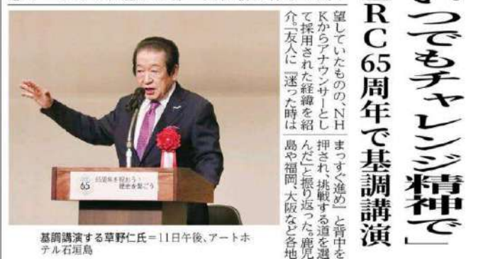
基調講演する草野仁氏=11日午後、アートル石垣島

11日、石垣ロータリークラブ創立65周年記念式典に合わせ、元NHKキヤスターの草野仁氏が「いつもチャレンジ精神で」と題して基調講演した。草野氏は自身の経験を交えながら、人間の仕事を観や挑戦する姿勢の大切さを語った。