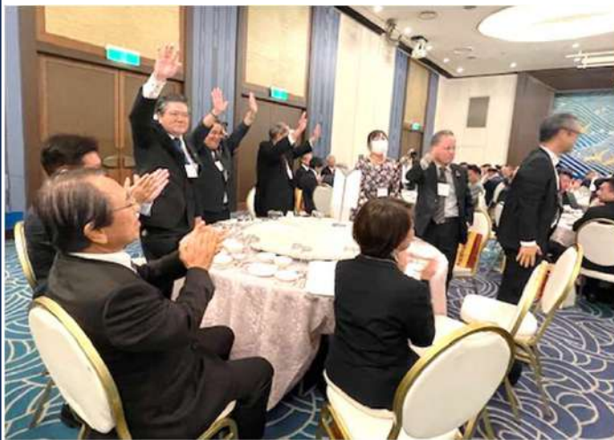
参加クラブ紹介 宜野湾RCメンバー