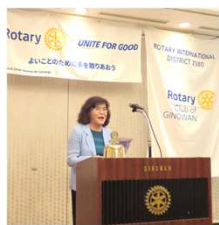
IJ思想推進宣言：阿嘉よね子会員