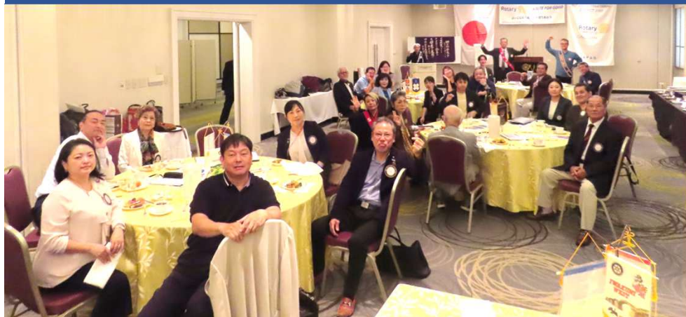
第2678回例会を終えて(^^)集合写真!!