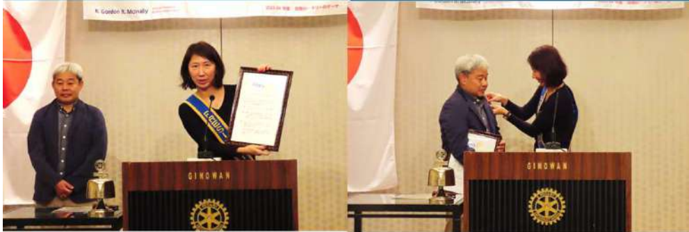
「ロータリーの目的」授与