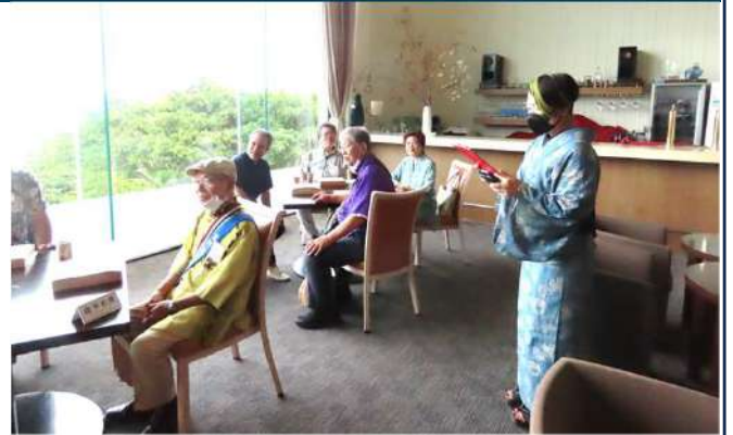
本日の司会 山城会場監督委員長