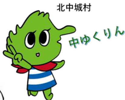
北中城村 中ゆくりん