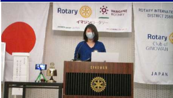
平仲会長エレクト