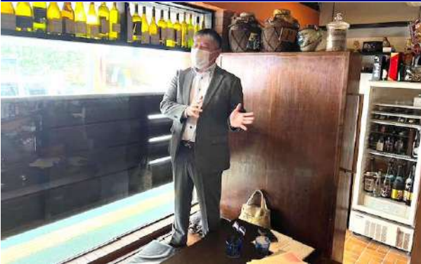
開会の点鐘及び会長