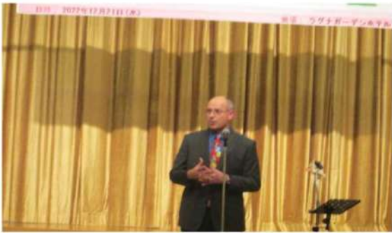
来賓ご挨拶 トーマス・パイナラー大佐