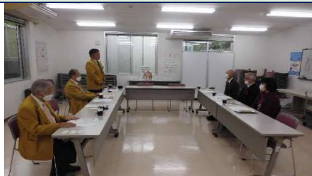
北谷町社会福祉協議会の皆様と面談