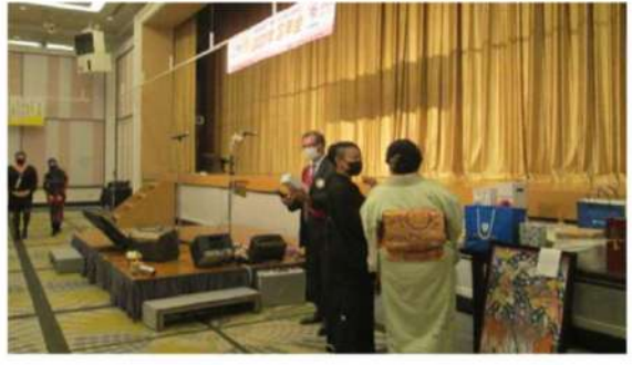
オークションスタート