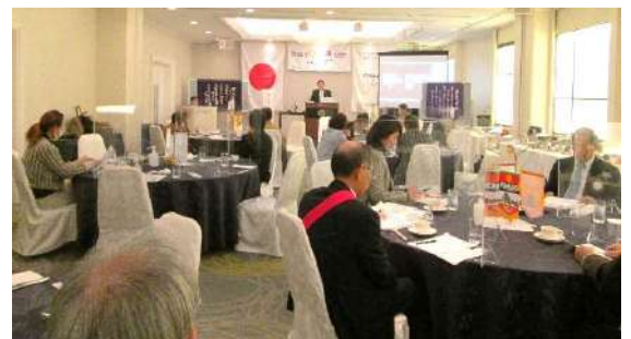
クラブ総会の様子