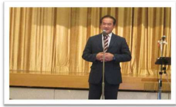
佐喜眞敦宜野湾前市長ご挨拶