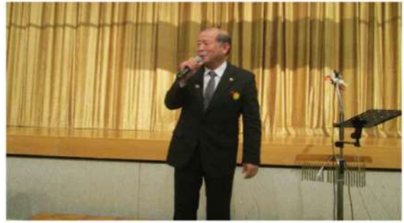
来賓ご挨拶 松川正則宜野湾市長