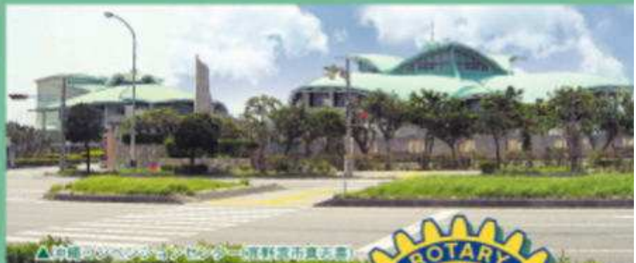
▲ 宜野湾市立総合体育館 (新垣町)