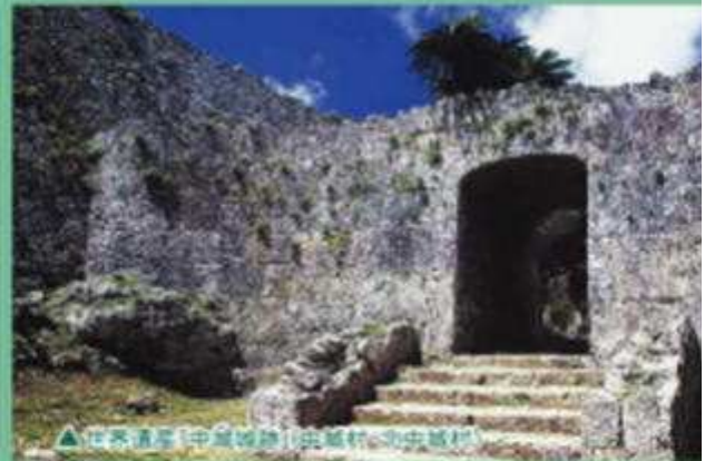
▲ 世界遺産「中城跡跡」(金城村・北中城村)