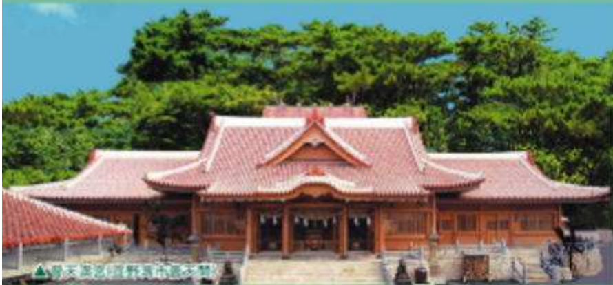
▲ 天徳寺 (新垣神社境内)