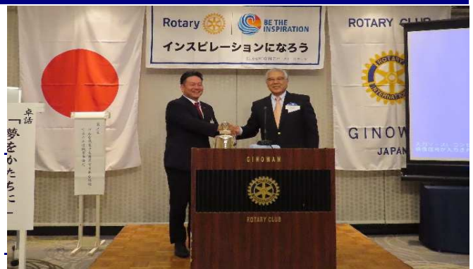
会員章バッジを胸に固い握手