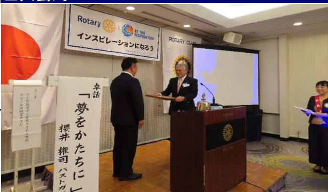
ロータリーの目的贈呈