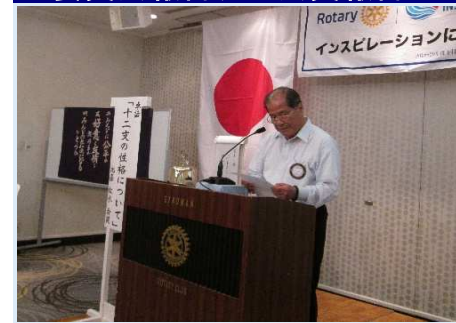
愛隣園福祉バザーへの協力支援について呼びかけ。