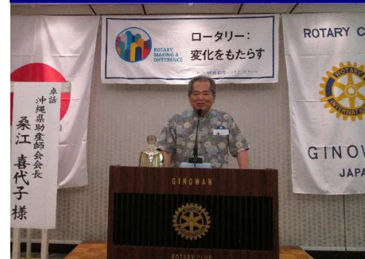
山里将パストガバナー補佐