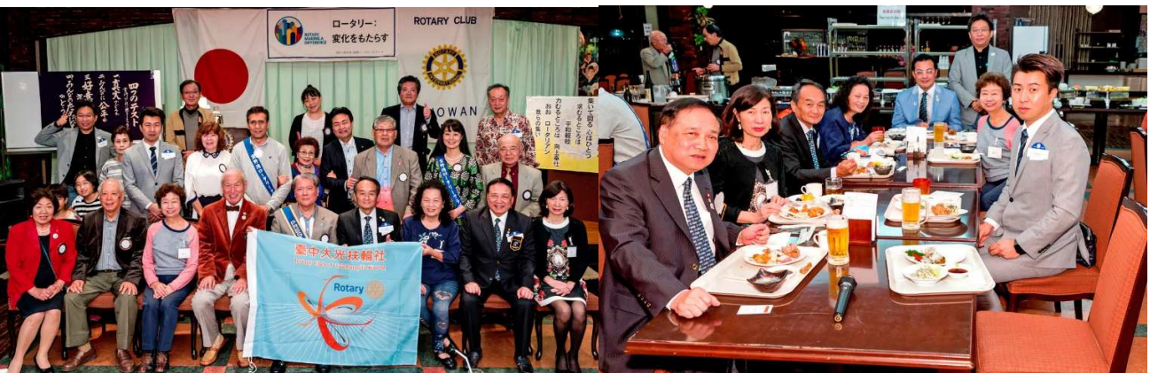
台中大光RCの皆様を歓迎して！