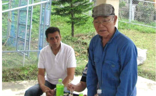
白間国際奉仕委員長