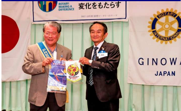
永山会長とHouse会長 (台中大光RC)