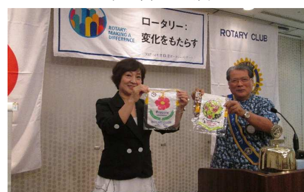
バナー交換（札幌はまなすRC）